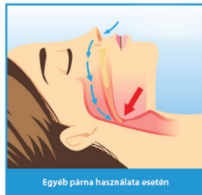
Egyéb párna használata esetén