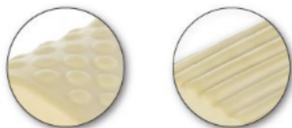
Kétoldalú masszázsfelület Double side massaging surface