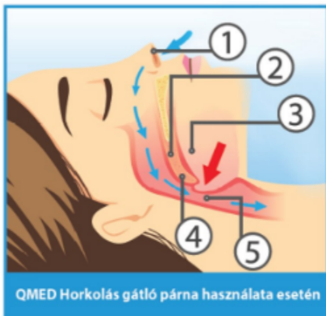
QMED Horkolás gátló párna használata esetén

Csökkenti a horkolást, javítja az alvás minőségét és hatékonyan támasztja meg a fejet, nyakat, vállakat és a hát felső részét. A párna kétoldalú masszázsfelülete javítja a párna szellőzését.